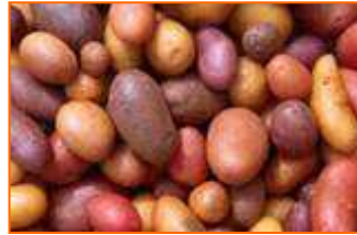
Pomme de terre « la Cartoufle »